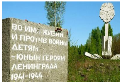
«Цветок жизни» – посвящен погибшим детям блокадного Ленинграда.

В ознаменование подвига войск, массового героизма и мужества населения Ленинграда в 1942 г. была учреждена медаль «За оборону Ленинграда», 8 мая 1965 года в честь 20-летия Победы Ленинград награжден медалью «Золотая Звезда!» [2] .