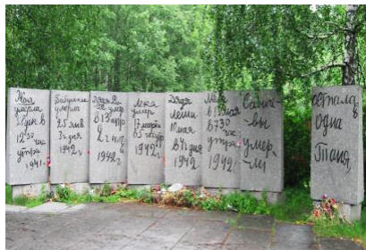
Гранитные стелы, в виде страниц из записной книжки одиннадцатилетней ленинградской школьницы Тани Савичевой, которая в блокаду потеряла всю семью.