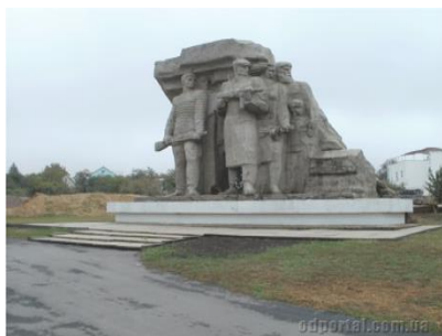
Памятник «Народные мстители» - памятная стелла, которая образует мемориальный комплекс "Катакомбы".