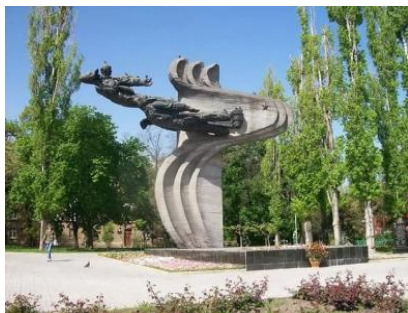
Памятник лётчикам-героям 69-го истребительного авиаполка, установлен в 1984 году на месте военного аэродрома.