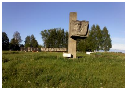
Мемориальный комплекс «Лемболовская твердыня», воздвигнутый на месте бывшего переднего края обороны.